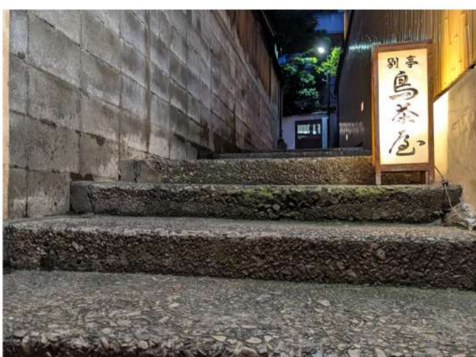
素敵なアプローチ